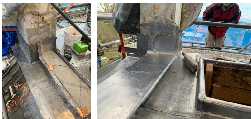
Voorbeeld van de werkzaamheden aan de fundatiebalken en de vloer.

Momenteel wordt gewerkt aan het met lood bekleden van de vloer onder de klok en de fundatiebalken van de klokkenstoel. Ook wordt een nieuwe waterdichte doorvoering aangebracht voor de bekabeling. De verwachting is dat deze werkzaamheden aanstaande maandag afgerond worden.