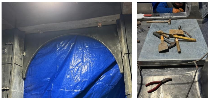
De met lood beklede bogen en het met zink beklede dakluik.

Nadat vorige week de timmerwerkzaamheden zijn afgerond, is deze week de loodgieter gestart met het bekleden van alle houten delen met lood om het hout te beschermen en de toren waterdicht te maken. Dit ambachtelijke werk wordt uitgevoerd door Walter Verhoeven BV uit Nieuwkuijk. Inmiddels zijn de bogen aan de bovenzijde van de toren met lood en het dakluik met zink bekleed.